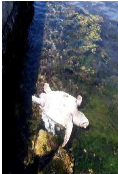
FOTOGRAFIJE UGINULIH ŽIVOTINJA

5. ČIŠĆENJE ŠUTA i drugih otpadaka koji ne spadaju u otpad iz domaćinstva vrši se po potrebi. Ovi poslovi obavljaju se povremeno, a u toku priprema za turističku sezonu moraju biti organizovani tako da se iz svih naselja pakuje i odvezu do trajne deponije predviđene za ovu vrstu otpadaka. Nisu rijetki slučajevi da ova vrsta otpada završava pored posuda za odlaganje otpada ili divljim deponijama.